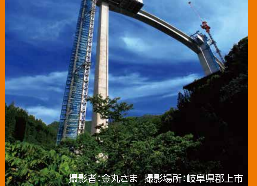
撮影場所:岐阜県郡上市