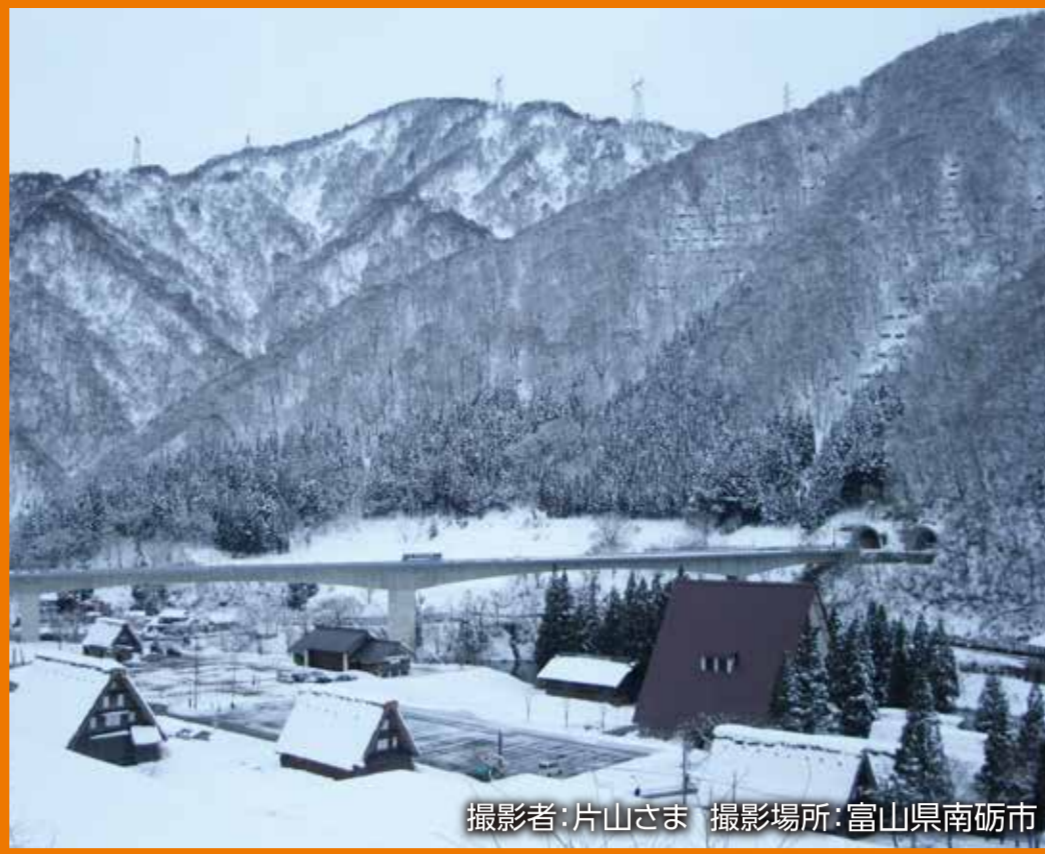
撮影場所:富山県南砺市