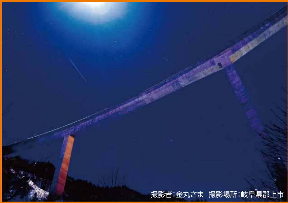
撮影場所:岐阜県郡上市