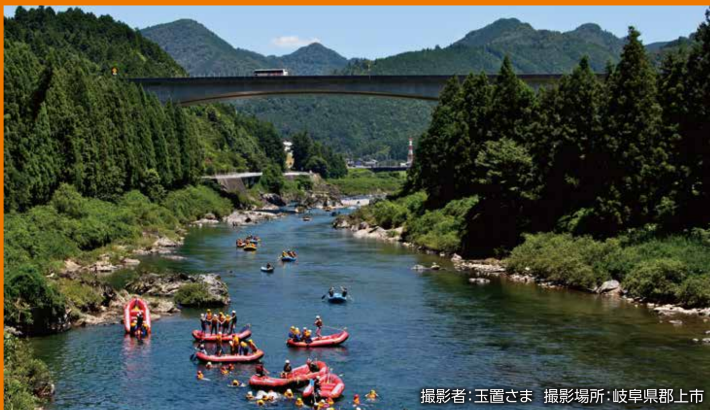
撮影場所:岐阜県郡上市