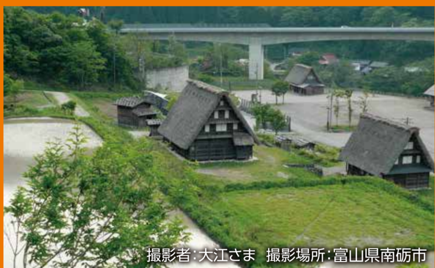
撮影場所:富山県南砺市

お客さまから「高速道路と風景フォトコンテスト」にご応募いただいた 写真をもとに、感謝の気持ちを込めてこのポスターを作りました。