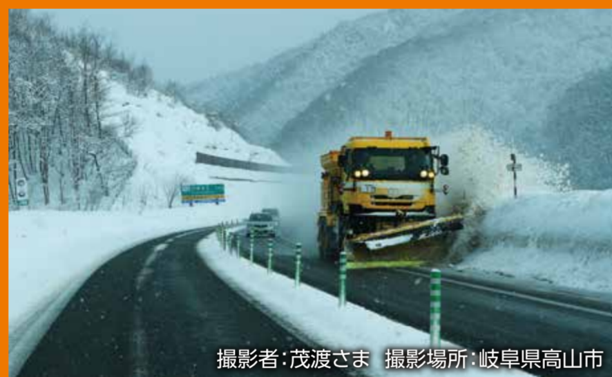
撮影場所:岐阜県高山市