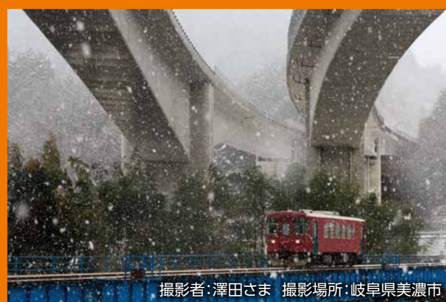
撮影場所:岐阜県美濃市