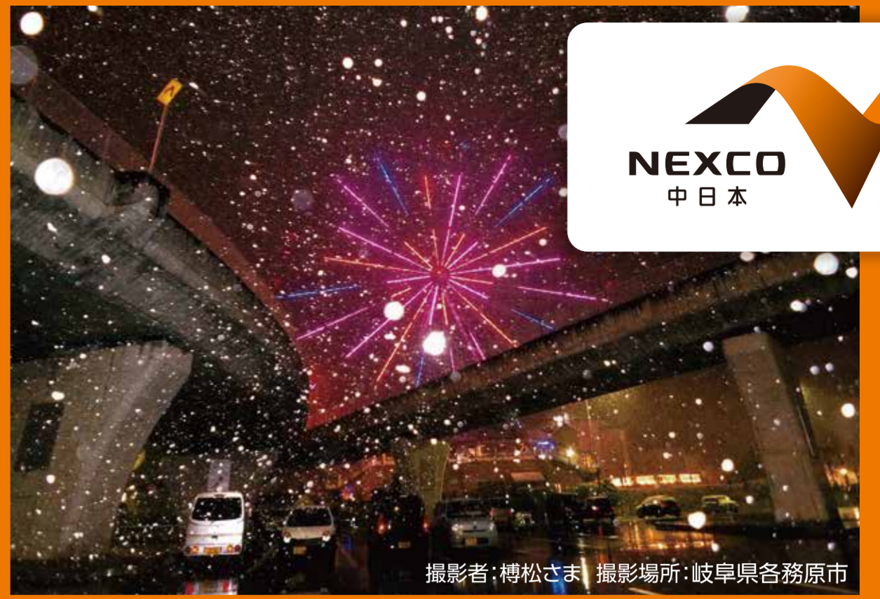
撮影場所:岐阜県各務原市