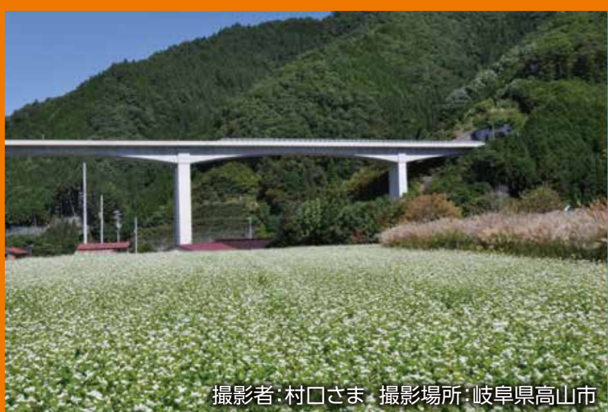
撮影場所:岐阜県高山市