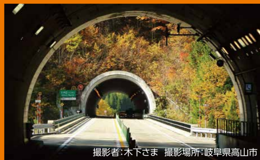
撮影場所:岐阜県高山市