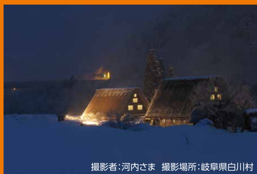
撮影場所:岐阜県白川村